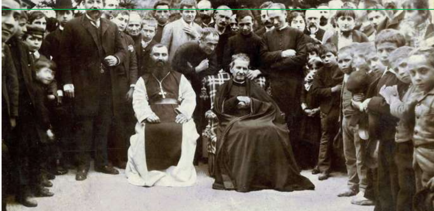
Don Ivan Bosko u Barceloni 3. svibnja 1886.

prijestup, koliko ga pokušati spriječiti, stvarajući djeci okruženje lišeno svega što bi moglo narušiti njihov skladan razvoj. Nije to sve bila samo njegova zasluga: u to su vrijeme ovu tezu zastupali brojni europski pedagozi: od Stroebela do Pestalozzija, od Herberta do Neckera i Saussurea. No, te su zamisli prevladavale u aulama sveučilišta, dok je u praksi još uvijek vladala represivna metoda. Naš je svetac shvatio vrijednost tih metoda i stao ih primjenjivati. „Practiciranje preventivne metode - pisao je - u potpunosti se oslanja na riječi svetoga Pavla, koji kaže: „ljubav je velikodušna, dobrotiva je ljubav; sve pokriva, sve vjeruje, svemu se nada, sve podnosi.“