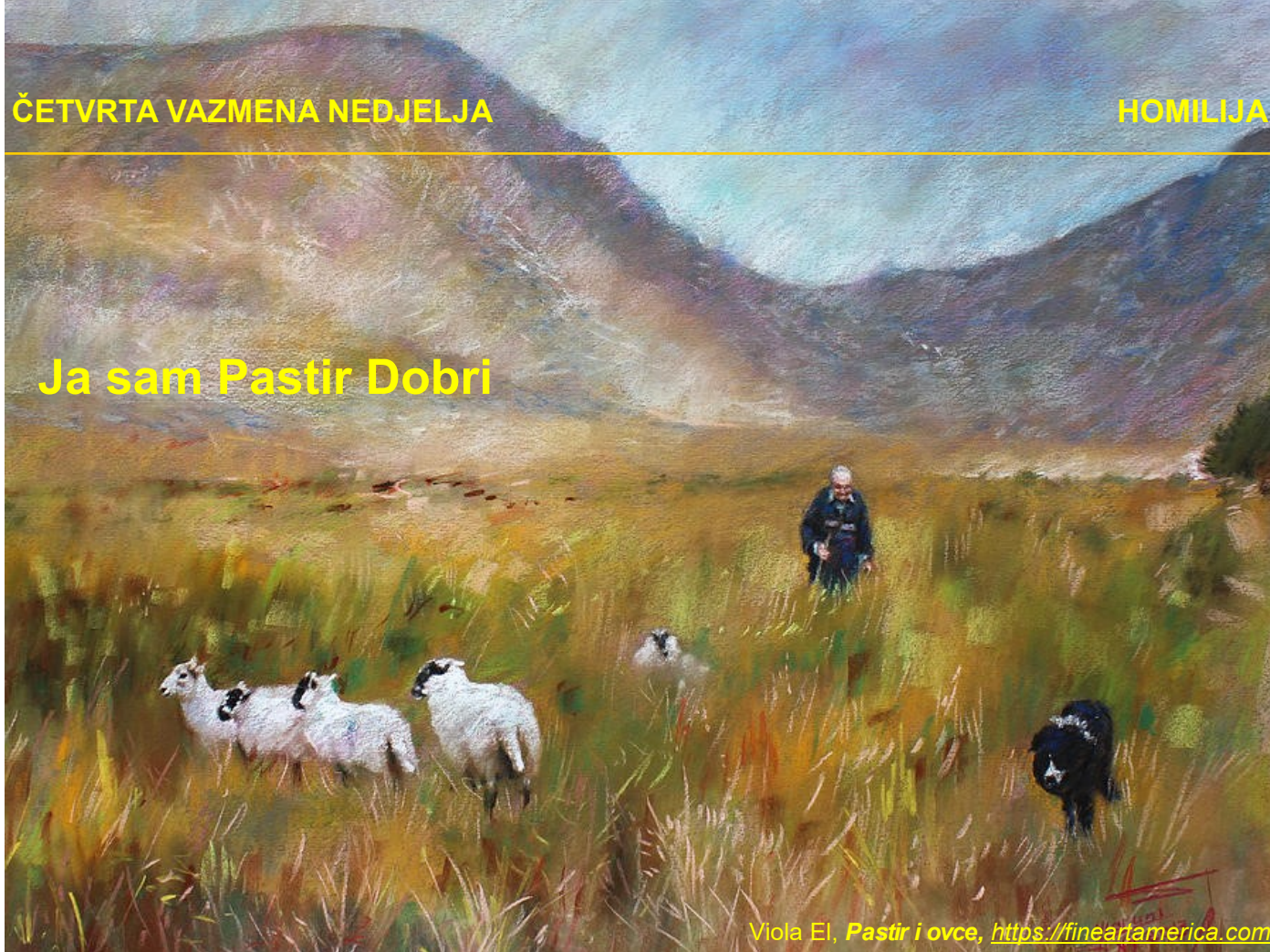
Viola El, Pastir i ovce , https://fineartamerica.com