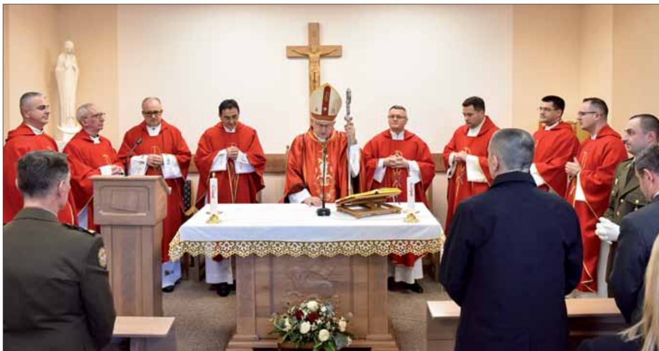
Misa i blagoslov vojne kapelice „Sveti Valentin“ u sjedištu Počasno-zaštitne bojne (PZB) na Tuškancu u Zagrebu, 15. veljače 2024.