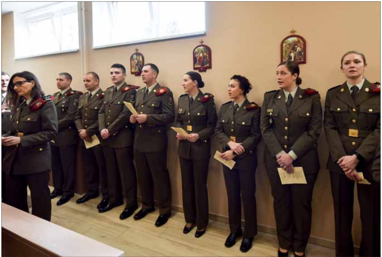
Misa i blagoslov vojne kapelice „Sveti Valentin“ u sjedištu Počasno-zaštitne bojne (PZB) na Tuškancu u Zagrebu, 15. veljače 2024.