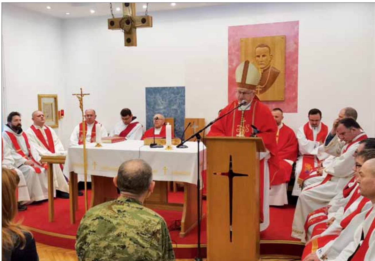
Sveta misa povodom proslave Dana vojne kapelanije „Blaženi Alojzije Stepinac“ u karlovačkoj vojarni „Stožerni general Petar Stipetić“, Karlovac 9. veljače 2024.

U karlovačkoj vojarni „Stožerni general Petar Stipetić“, u sjedištu Zapovjedništva Hrvatske kopnene vojske (HkoV), u petak 9. veljače, svečanom koncelebriranom svetom misom proslavljen je Dan vojne kapelanije „Blaženi Alojzije Stepinac“, a ujedno i 25. godišnjica osnivanja ove vojne kapelanije.