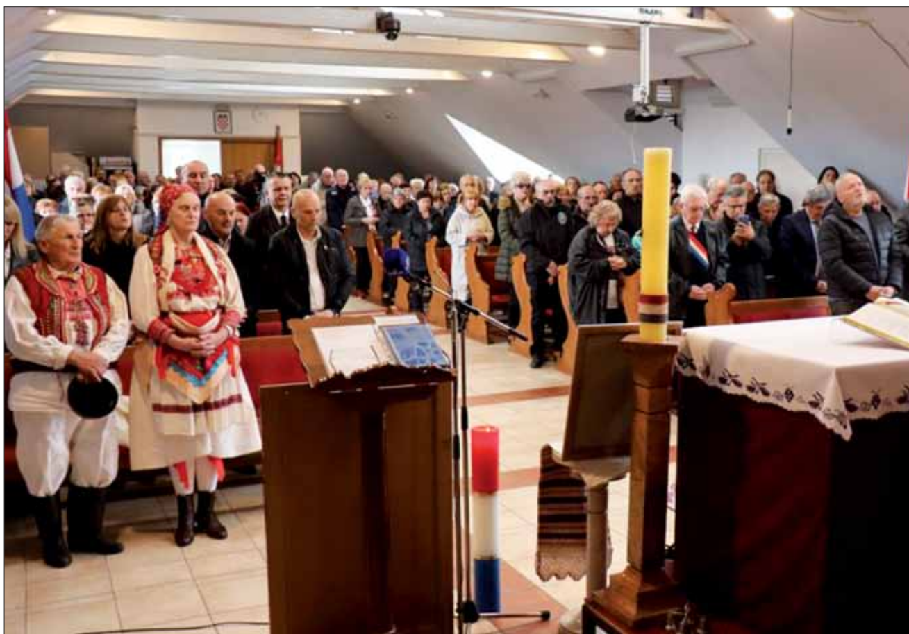
Sveta misa povodom 128. obljetnice smrti dr. Ante Starčevića, Šestine, 28. veljače 2024.

Na obilježavanju je sudjelovalo više stotina vjernika koji su došli iz svih krajeva Hrvatske. Liturgijsko pjevanje predvodili su članovi Hrvatskog seljačkog pjevačkog društva Sljeme Šestine.