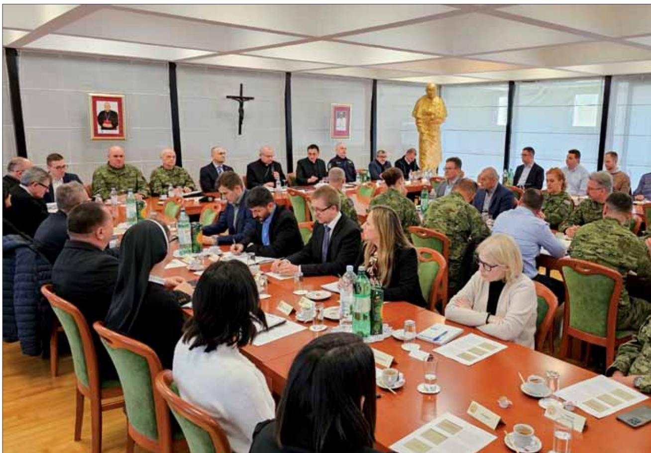
Sastanak s ministrom obrane Ivanom Anušićem, 21. ožujka 2024.

U četvrtak 21. ožujka potpredsjednik Vlade Republike Hrvatske i ministar obrane Ivan Anušić sa suradnicima sastao se s vojnim ordinarijem u Republici Hrvatskoj msgr. Jurem Bogdanom u Vojnom ordinarijatu.