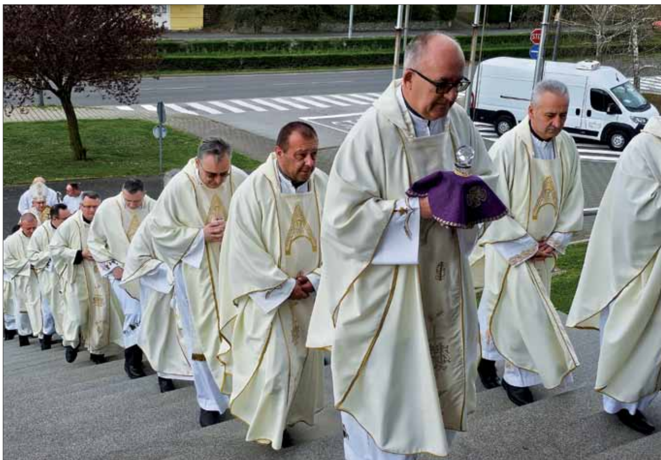
Misa posvete ulja u Vojnom ordinarijatu, 28. ožujka 2024.

Na Veliki četvrtak 28. ožujka 2024. u kape- li Vojnog ordinarijata, vojni ordinarij msgr. Jure Bogdan predslavio je misu posvete ulja. Ova misa, u kojoj se blagoslivlja bolesničko ulje i posvećuje krizma, na osobit način oči- tuje zajedništvo prezbitera s njihovim bisku- pom. Biskup je predvodio euharistijsko slav- lje uz koncelebraciju vojnog biskupa u miru msgr. Jurja Jezerinca i vojnih i policijskih kapelana. Na misi su sudjelovali i djelatnici Vojnog ordinarijata, pomoćnici kapelana, djelatnici MUP-ove Samostalne službe za su- radnju s Vojnim ordinarijatom i MORH-ova Samostalnog odjela za potporu Vojnome or- dinarijatu.