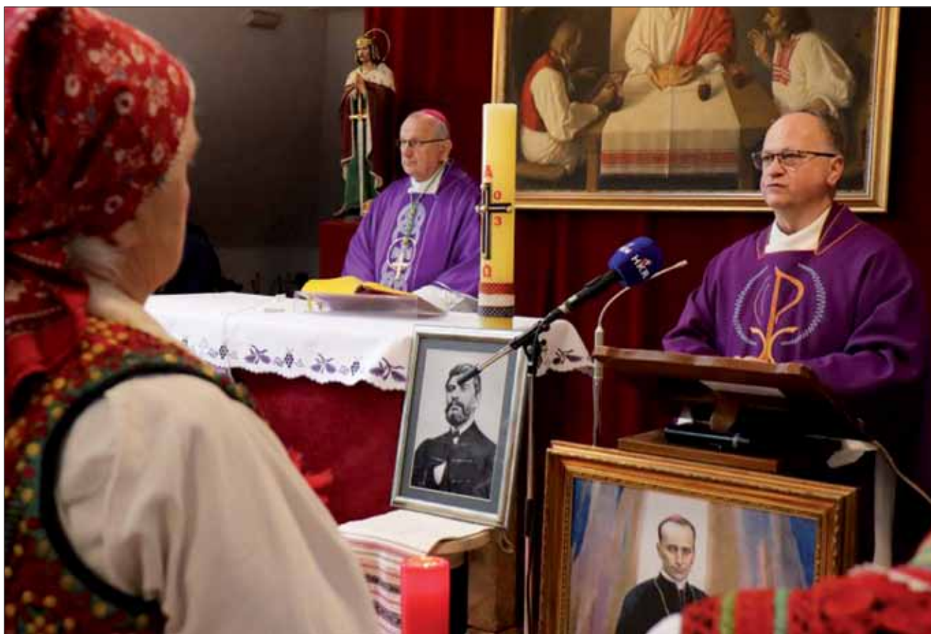
Sveta misa povodom 128. obljetnice smrti dr. Ante Starčevića, Šestine, 28. veljače 2024.