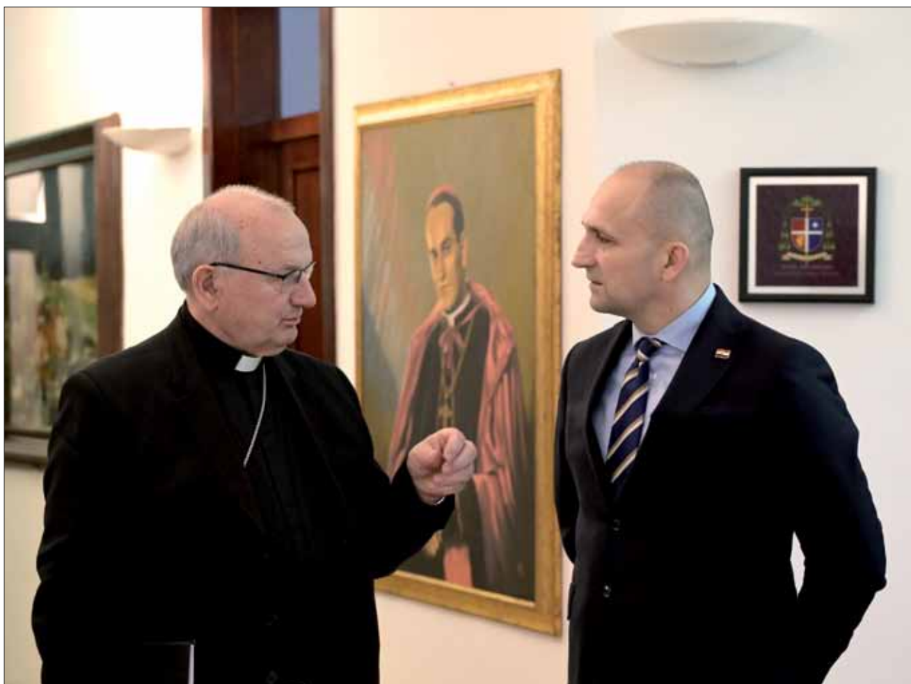
Posjet ministra Anušića Vojnom ordinarijatu, 21. ožujka 2024.

Ove godine, hodočašće u Lourdes održat će se od 21. do 28. svibnja, u sklopu 64. međunarodnog vojnog hodočašća čije je geslo ove godine: „Neka mi ljudi dolaze u procesiji.“