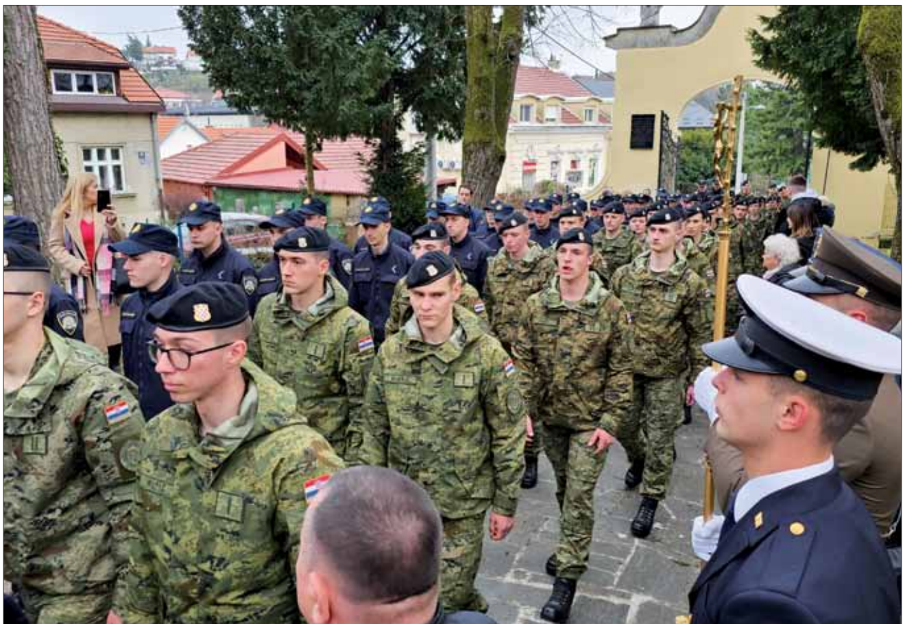
Križni put za vojsku i policiju na Ksaverskoj kalvariiji u Župi sv. Franje Ksaverskog u Zagrebu, 10. ožujka 2024.