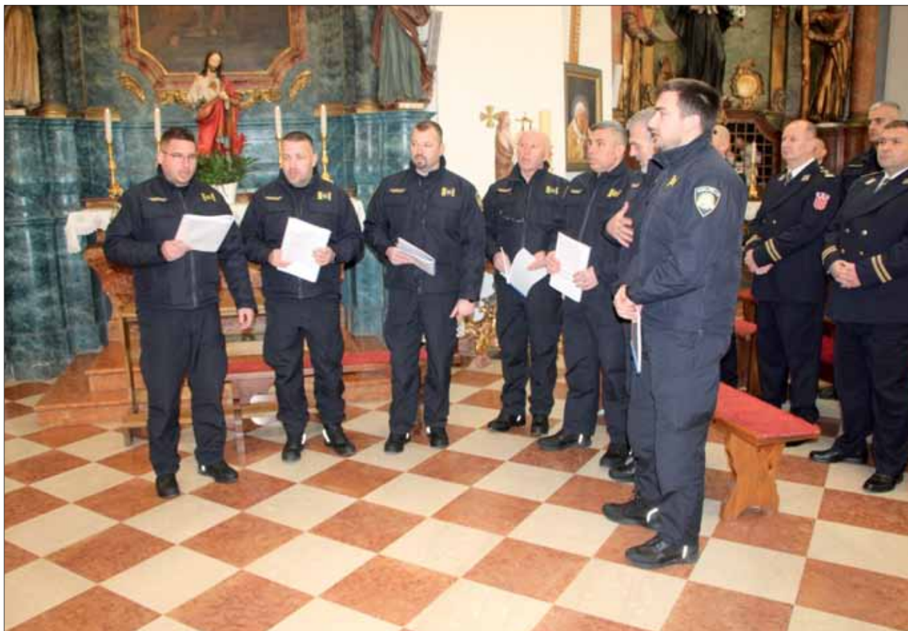
Policijska klapa „Sveti Mihovil“ u crkvi svetoga Roka, Vinkovci, 8. veljače 2024.

Liturgijsko pjevanje predvodila je policijska klapa „Sveti Mihovil“.