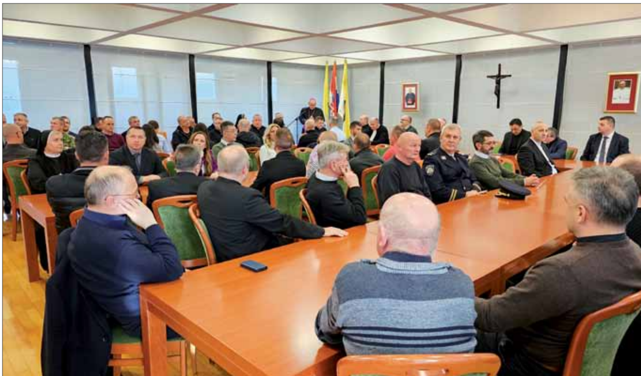
Božićno čestitanje u Vojnom ordinarijatu RH, Zagreb, 15. prosinca 2023.

s odobravanjem i podjelama, u složenom platnu iskustva i vjere, milosti i slobode. U svakom od ovih glasova života bila je skrivena melodija Božja koja, da bi se ispravno shvatila, mora biti tumačena umijećem vjere. U svjetlu vjere, pozvani smo promatrati i sve ono što se zbivalo u našoj Vojnoj biskupiji u godini koja je na izmaku te u poniznosti srca znati reći Bogu hvala na svemu.“