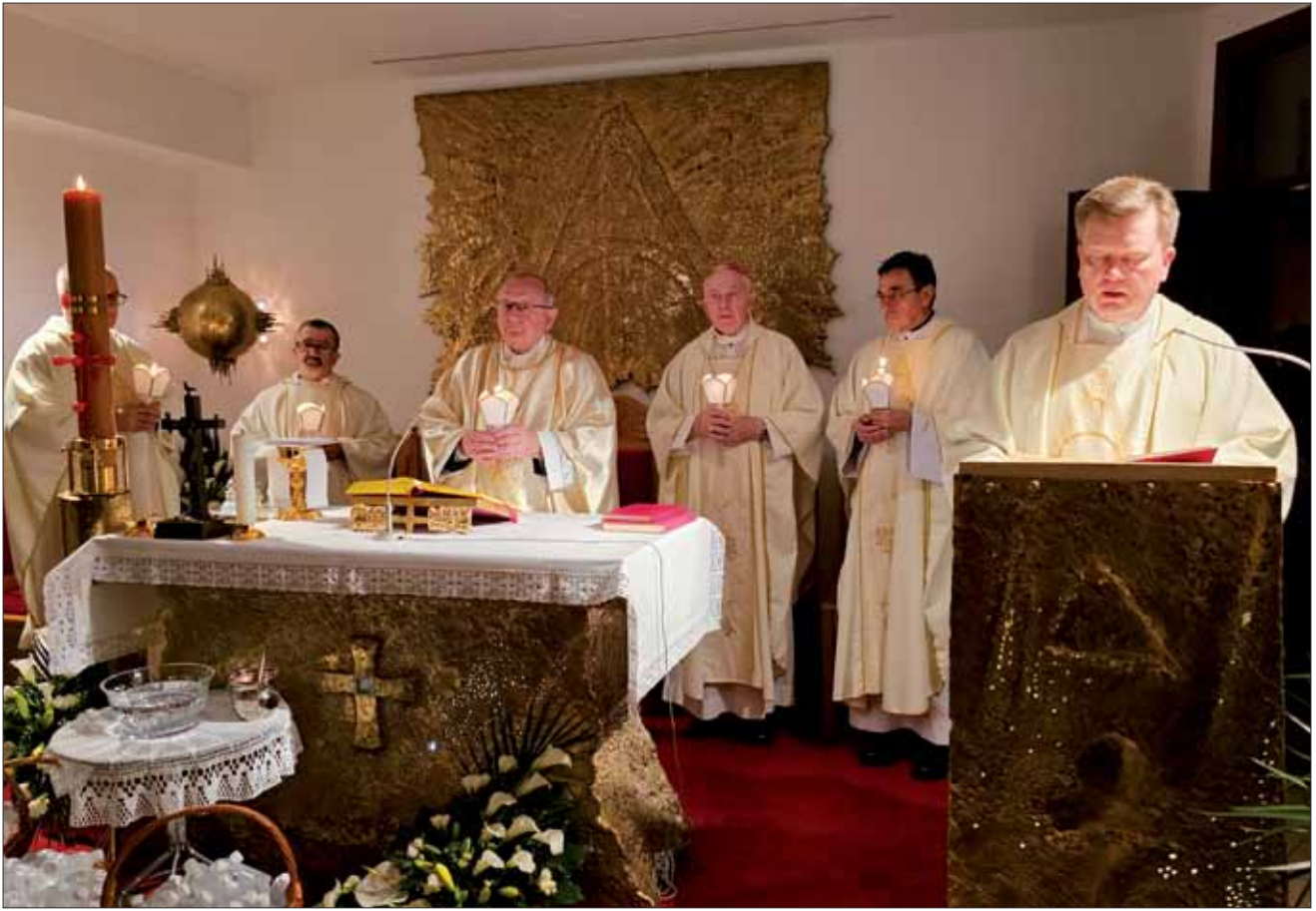
Vazmeno bdijenje u Vojnom ordinarijatu, 30. ožujka 2024.