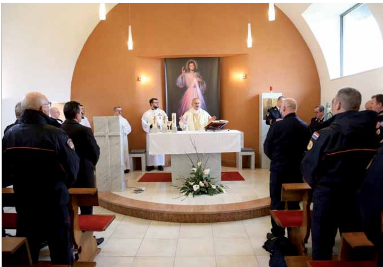
Sv. misa u kapeli sv. Sebastijana u Logističkom centru Jastrebarsko, 1. ožujka 2024.