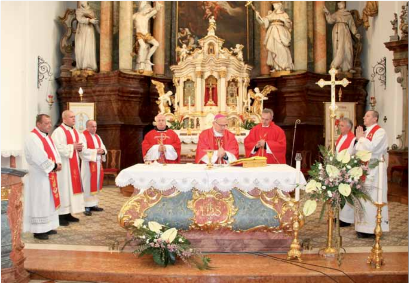
Sveta misa u župnoj crkvi svetoga Roka, Vinkovci, 8. veljače 2024.