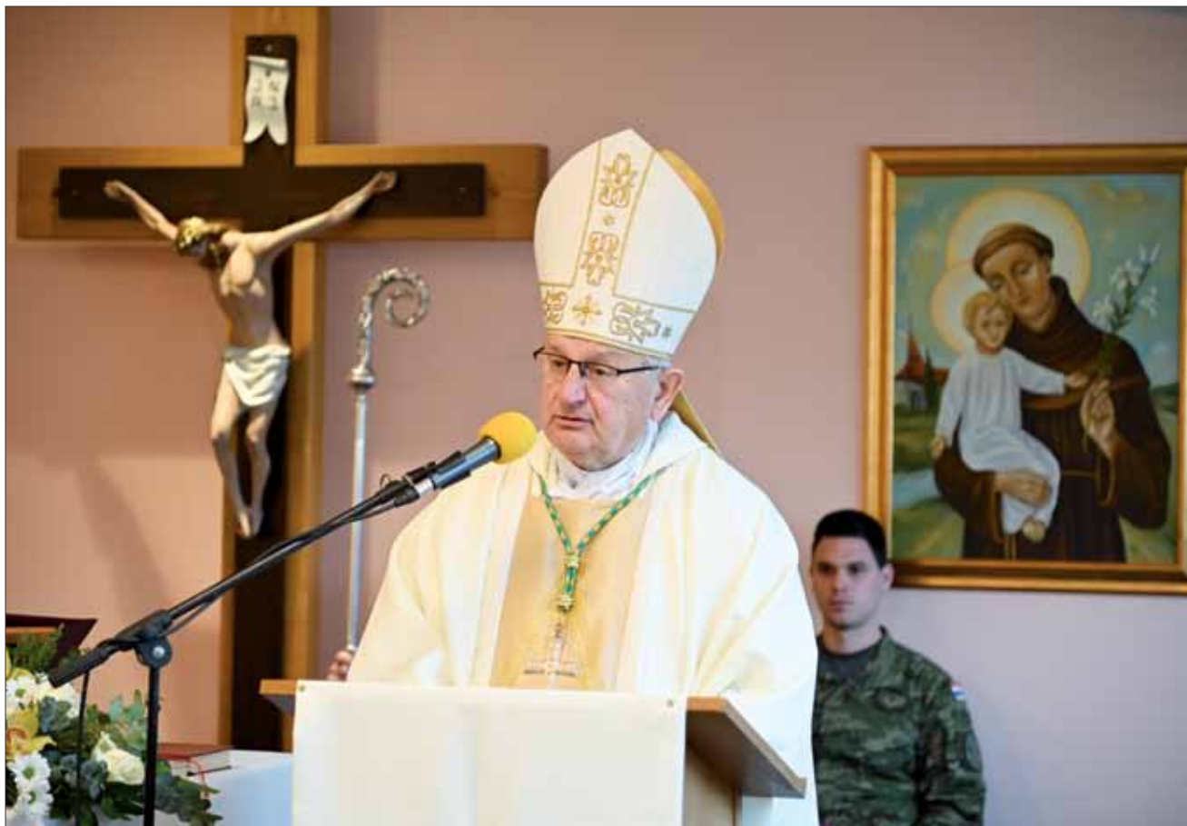
Sveta misa u kapelici „Sveta Obitelj“ u vojarni „1. gardijske brigade Tigrovi – Croatia“, Zagreb, 17. siječnja 2024.

U srijedu 17. siječnja, u vojarni „1. gardijske brigade Tigrovi – Croatia“ proslavljen je Dan vojne kapelanije „Sveta Obitelj“. U sklopu svečane proslave, vojni ordinarij msgr. Jure Bogdan je pastoralno pohodio kapelaniju, predvodio obred blagoslova djelatnika vojarne i predslavio svetu misu.