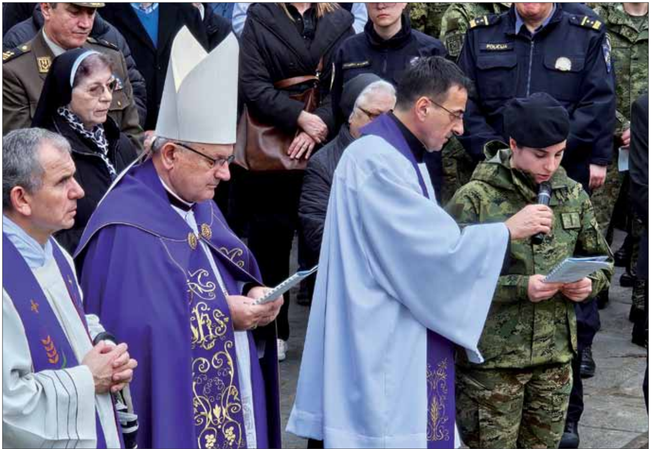
Križni put za vojsku i policiju na Ksaverskoj kalvariji u Župi sv. Franje Ksaverskog u Zagrebu, 10. ožujka 2024.