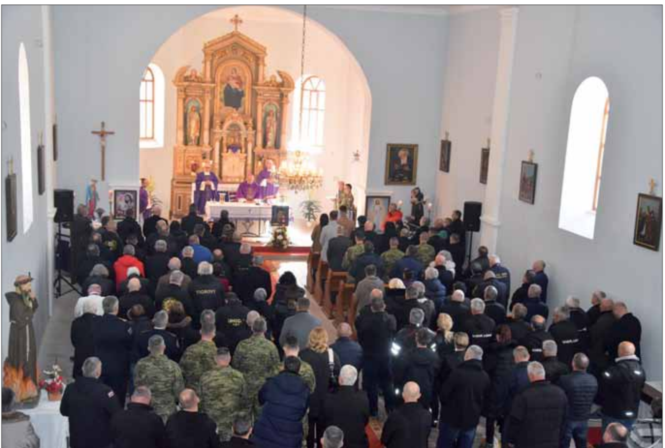
Svetu misu u župnoj Crkvi BDM Snježne u Krivom Putu predvodio je vojni ordinarij msgr. Jure Bogdan, 17. veljače 2024.

Vojni ordinarij rekao je kako je korizma povoljno vrijeme za obraćenje, u korizmi želimo promijeniti pogled na same sebe, staviti se pred Božje zrcalo i pred svjetlo Božje Riječi. Korizma je vrijeme u kojemu smo pozvani da se vratimo istini o sebi te se tako vratimo Bogu i drugim ljudima. „Svaka je pretpostavka samodostatnosti lažna i idoliziranje samih sebe je destruktivno i zaključava nas u kavez samoće. Naš je život prije svega odnos – primili smo ga od Boga i od roditelja. I uvijek ga možemo obnoviti i preporoditi po Gospodinu i onima koje je On pred nas stavio. Korizma je pogodno vrijeme da oživimo odnos