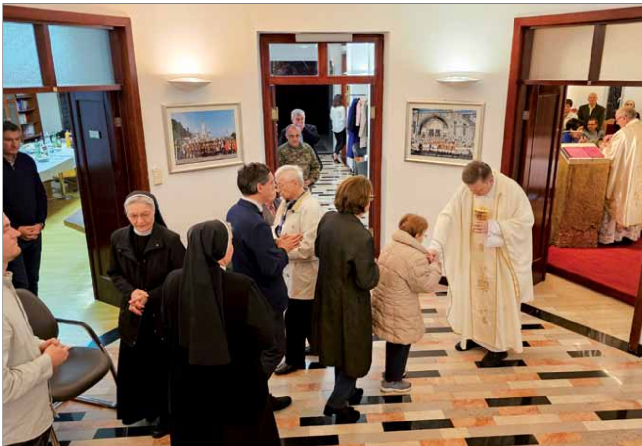
Vazmeno bdijenje u Vojnom ordinarijatu, 30. ožujka 2024.

ništvo prekinuto ljudskom voljom i nudeći spasenje. Jasno se prepoznaje povijest čovječanstva od postanka i prvoga grijeha, gubitka milosti zbog neposluha i iznevjerenosti Božjemu pozivu, tegobne i mučne stvarnosti hoda suznom dolinom, između grijeha, bezakonja i milosti, praštanja i Božje ljubavi; od Adamovih muka, bratoubojstva Kajinova, Abrahamove vjernosti i hoda u nepoznato, u daleke krajeve, preko Mojsijeva izlaska iz ropstva preko Crvenoga mora (u kojemu je jasno prepoznatljiv hod iz grijeha prema spasenju), ponovne iznevjerenosti na putu, poziva brojnih proroka. Sjeme Božje riječi, evanđeoske poruke, mora pasti na plodno tlo našega srca i rasti. Da bi se to ostvarilo, obvezni smo ukloniti trnje i draču koji ga mogu ugušiti. Trnje i drača poprimaju različite oblike i osobine: bezosjećajnosti, oholosti, sebičnosti, nepovjerenja, zlih nagnuća, zavisti, okrutnosti, nevjernosti i svih vrsta zala," naglasio je u svojoj propovijedi velečasni Frano.