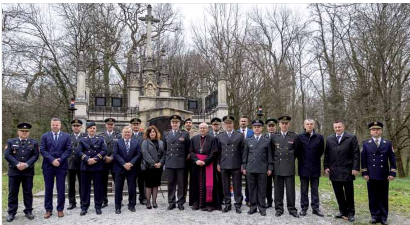
Ispred grobnice obitelji Jelačić u Zaprešiću, 19. ožujka 2024.

Svečano obilježanje svetkovine sv. Josipa u Zaprešiću završilo je polaganjem cvijeća i paljenjem svijeća na grobnici obitelji Jelačić, uz počasni plotun Kuburaškog društva Ban Josip Jelačić iz Zaprešića. Vojni ordinarij msgr. Jure Bogdan održao je pritom prigodnu molitvu.