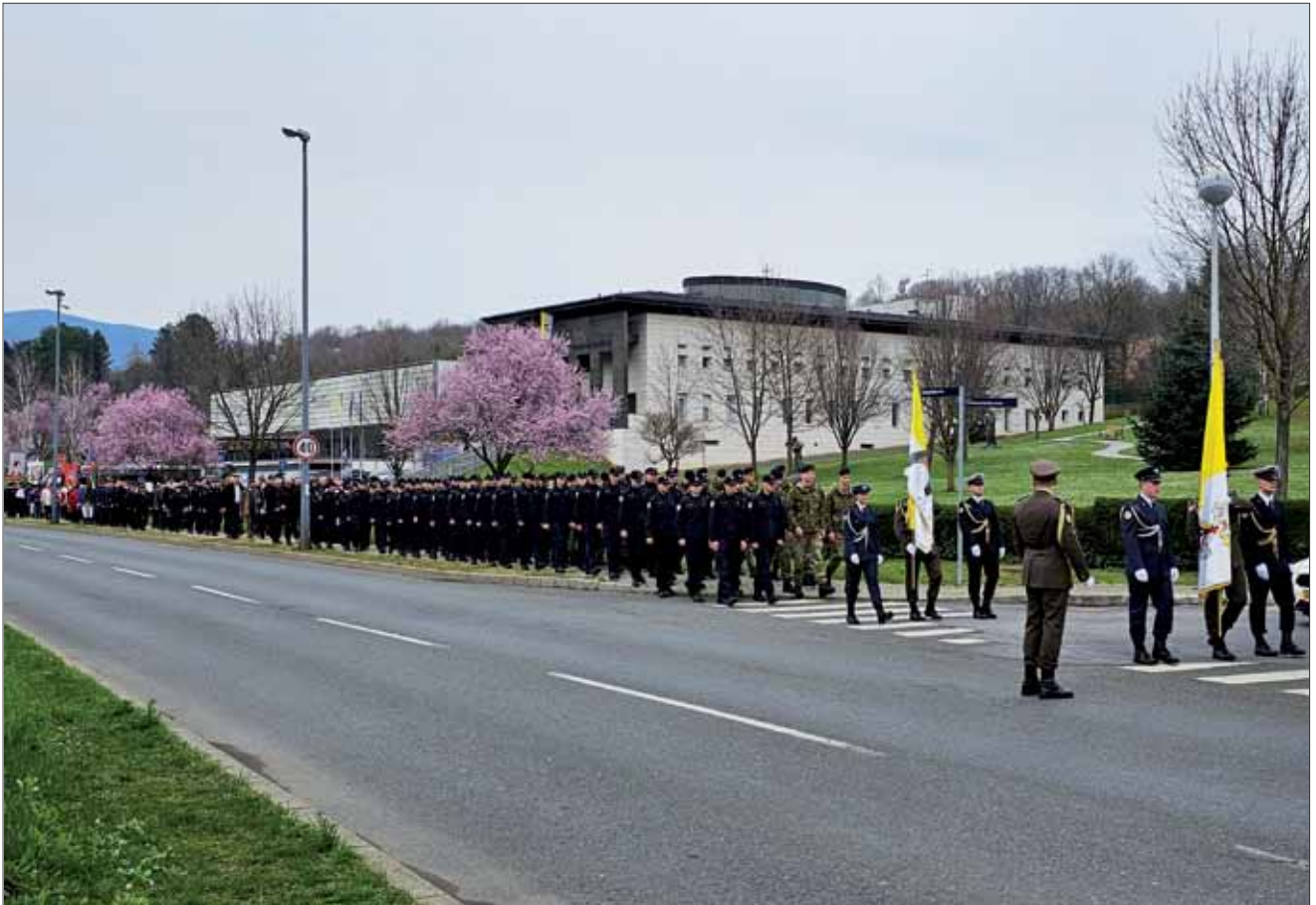
Procesija iz Vojnog ordinarijata prema Ksaverskoj kalvariji u Zagrebu, 10. ožujka 2024.

Kao i prethodnih godina, na Četvrtu korizmenu nedjelju, 10. ožujka 2024. godine, na Ksaverskoj kalvariji u Župi sv. Franje Ksaverskog u Zagrebu, održan je Križni put za katoličke vjernike pripadnike hrvatsku vojske i policije. Križni put predvodio je vojni ordinarij u RH msgr. Jure Bogdan, uz sudjelovanje pripadnika Oružanih snaga RH, Ministarstva obrane i Ministarstva unutarnjih poslova, kadeta Hrvatskog vojnog učilišta i polaznika Policijske akademije, vatrogasaca, povijesnih postrojbi, i brojnih drugih vjernika.