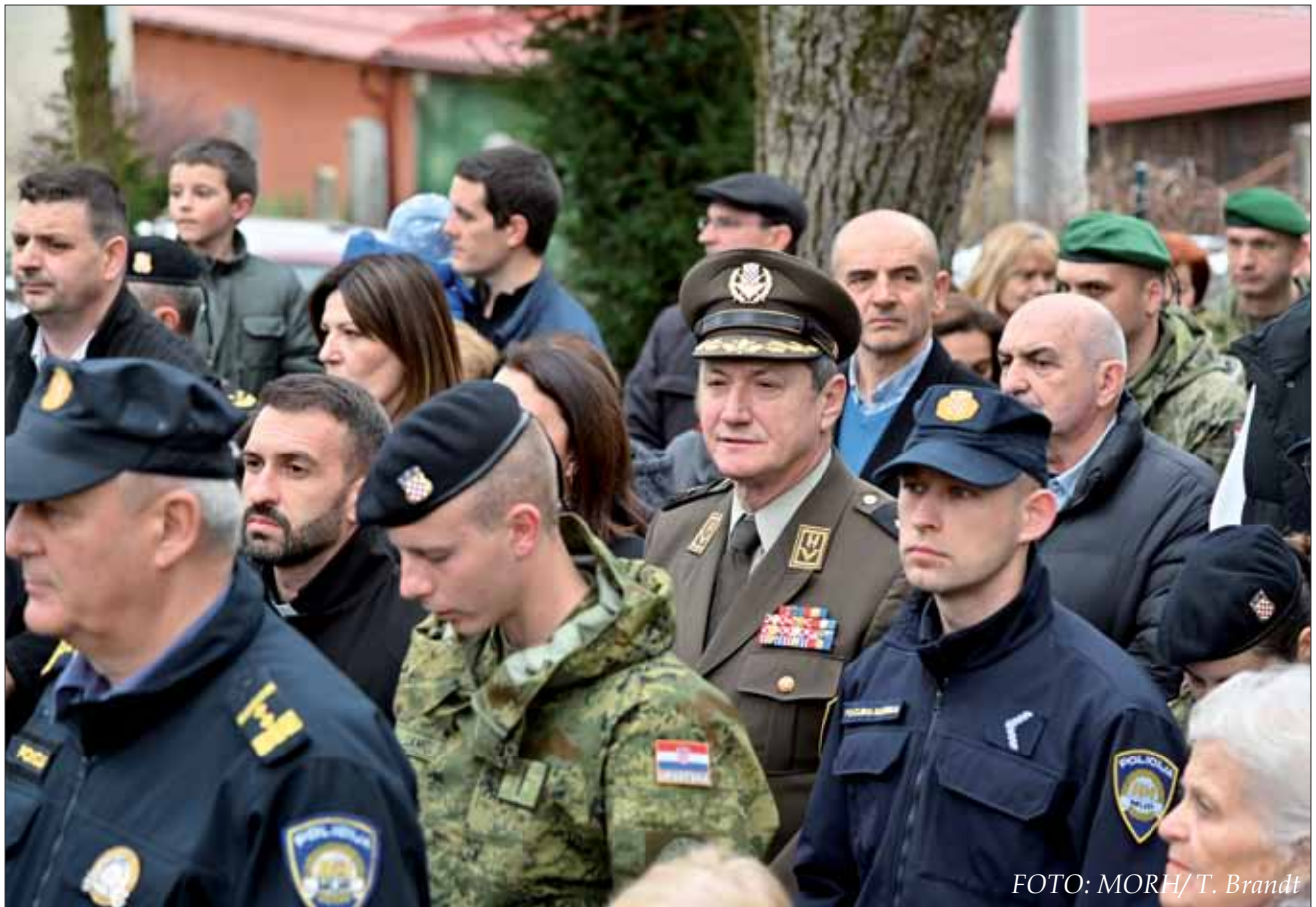
Križni put za vojsku i policiju na Ksaverskoj kalvariiji u Župi sv. Franje Ksaverskog u Zagrebu, 10. ožujka 2024.