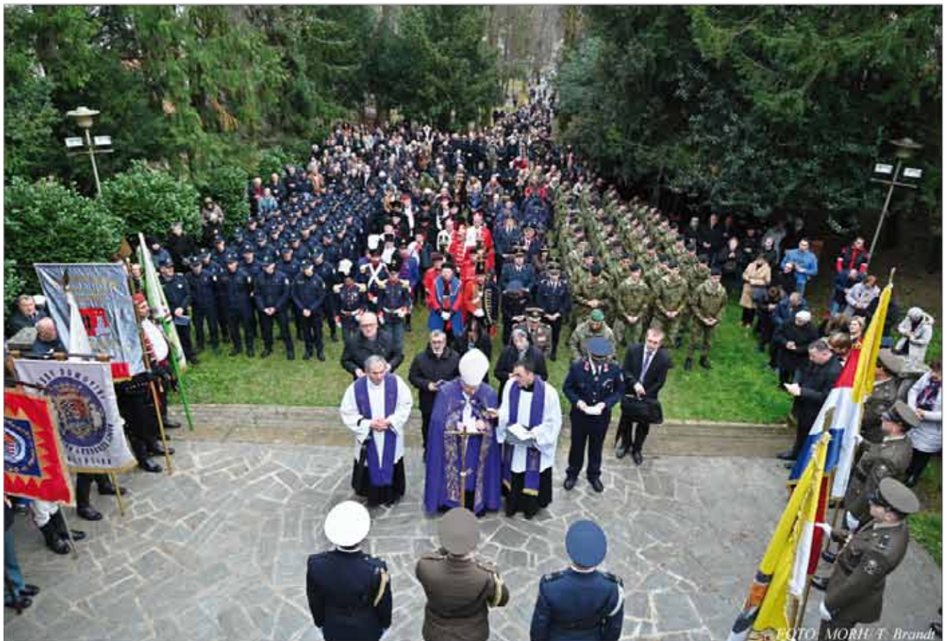
Križni put za vojsku i policiju na Ksaverskoj kalvariji u Zagrebu, 10. ožujka 2024.