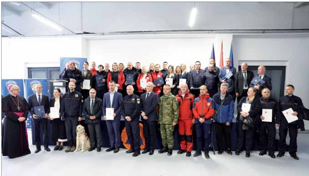
Vojni ordinarij msgr. Jure Bogdan s predstavnicima operativnih snaga civilne zaštite, Logistički centar Jastrebarsko, 1. ožujka 2024.

Svečanosti obilježavanja nazočili su potpredsjednik Vlade i ministar unutarnjih poslova Davor Božinović, ravnatelj Ravnateljstva civilne zaštite Damir Trut, predstavnici operativnih snaga civilne zaštite - Državne intervencijske postrojbe civilne zaštite, Hrvatske vatrogasne zajednice, Hrvatske gorske službe spašavanja, Hrvatskog Crvenog križa, Saveza izviđača Hrvatske i Hrvatskog centra za potresno inženjerstvo, kao i drugi visoki dužnosnici i strani veleposlanici. U sklopu obilježavanja održan je tehničko-taktički zbor gdje su pripadnici civilne zaštite izložili svoju opremu.