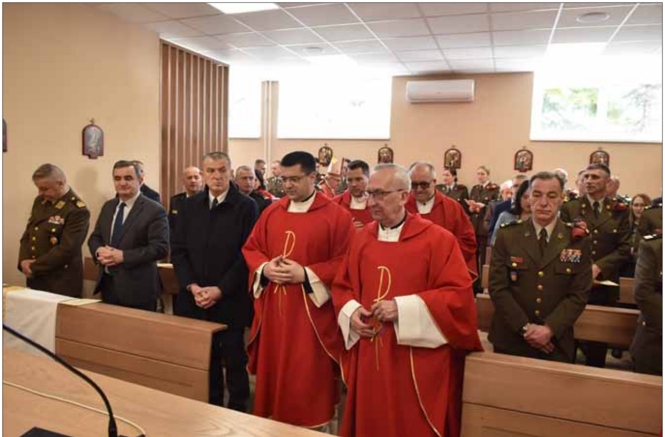
Misa i blagoslov vojne kapelice „Sveti Valentin“ u sjedištu Počasno-zaštitne bojne (PZB) na Tuškancu u Zagrebu, 15. veljače 2024.