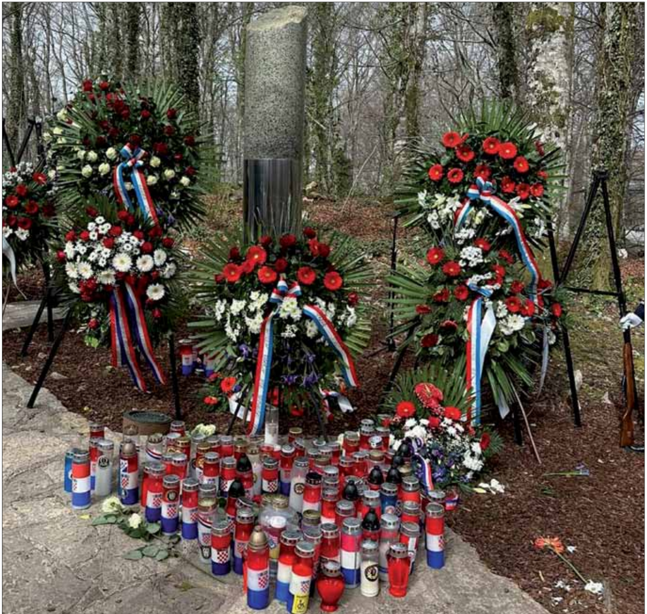
Komemoracija povodom 33. obljetnice pogibije Josipa Jovića