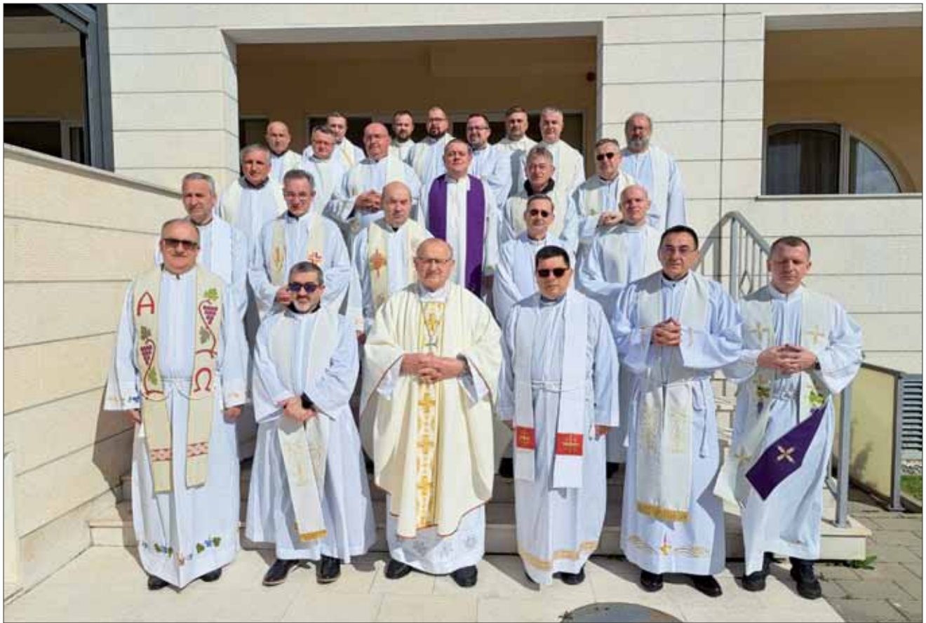
Svećenici Vojnog ordinarijata na Duhovnim vježbama u „Oazi sv. Marije Krucifikse“ Duhovnom centru Službenica Milosrđa – sestara Anćela na Kamenu pokraj Splita, 19. - 22. veljače 2024.