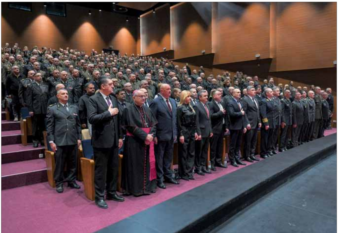
Svečani program proslave Dana Hrvatskog vojnog učilišta, Zagreb, 20. prosinca 2023.