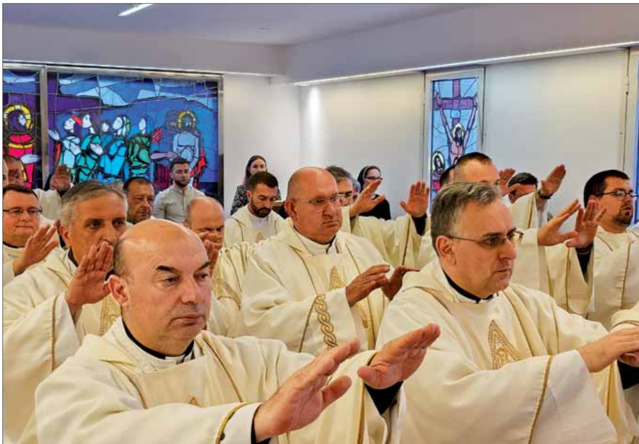
Misa posvete ulja u Vojnom ordinarijatu, 28. ožujka 2024.