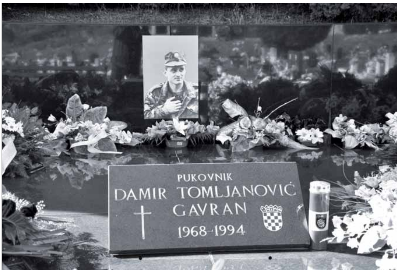
Spomen obilježje na groblju u Krivom Putu kod Senja, 17. veljače 2024.