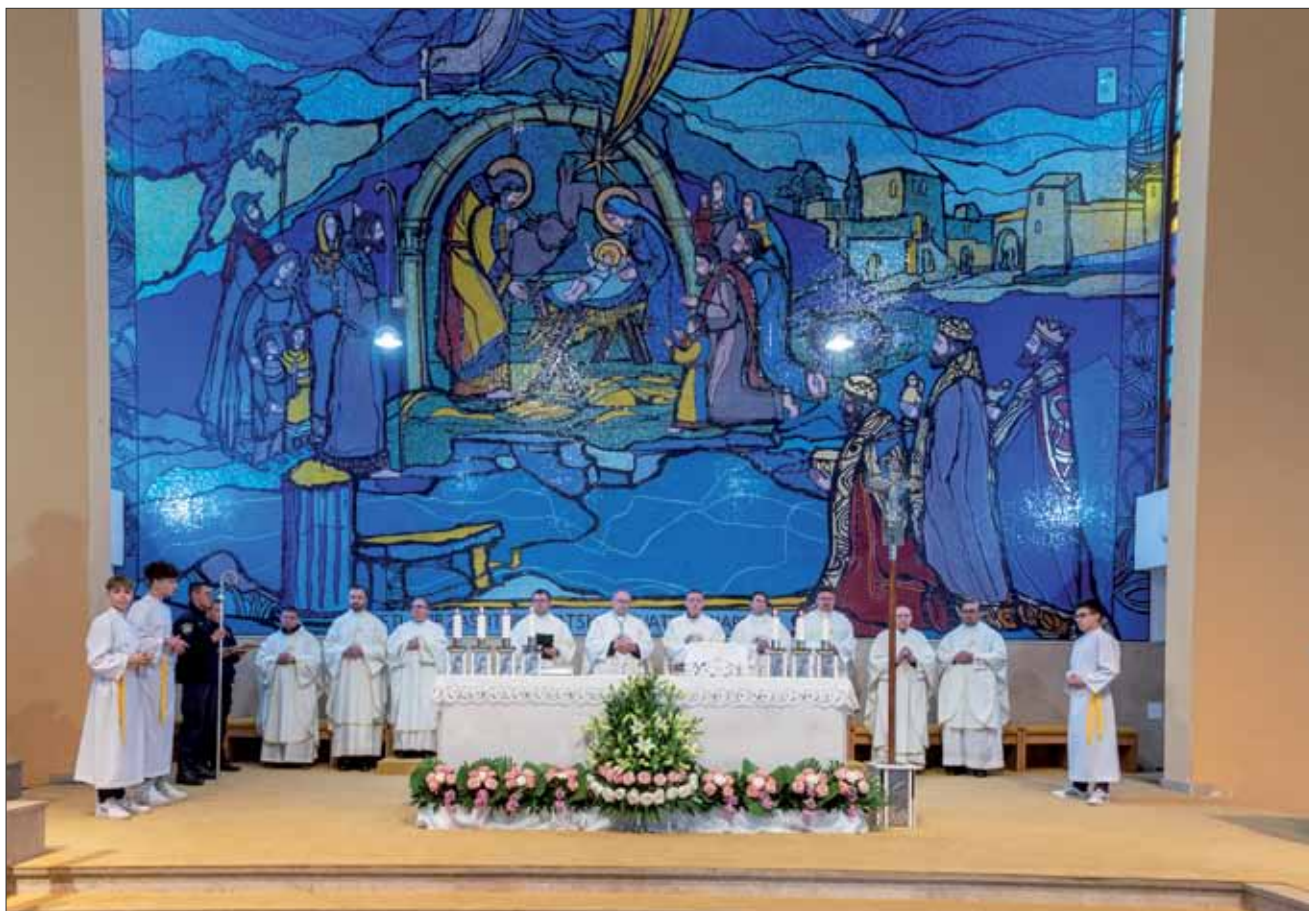
Misno slavlje u Nacionalnom svetištu sv. Josipa u Karlovcu, 18. ožujka 2024.