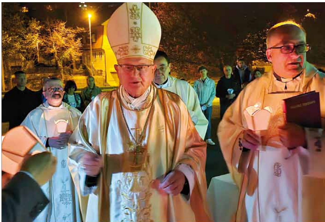
Vazmeno bdjenje u Vojnom ordinarijatu Zagreb, 30. ožujka 2024.