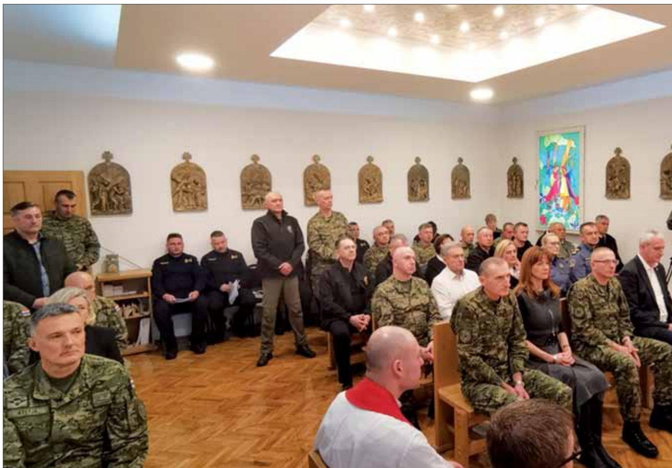
Sveta misa povodom proslave Dana vojne kapelanije „Blaženi Alojzije Stepinac“ u karlovačkoj vojarni „Stožerni general Petar Stipetić“, Karlovac 9. veljače 2024.