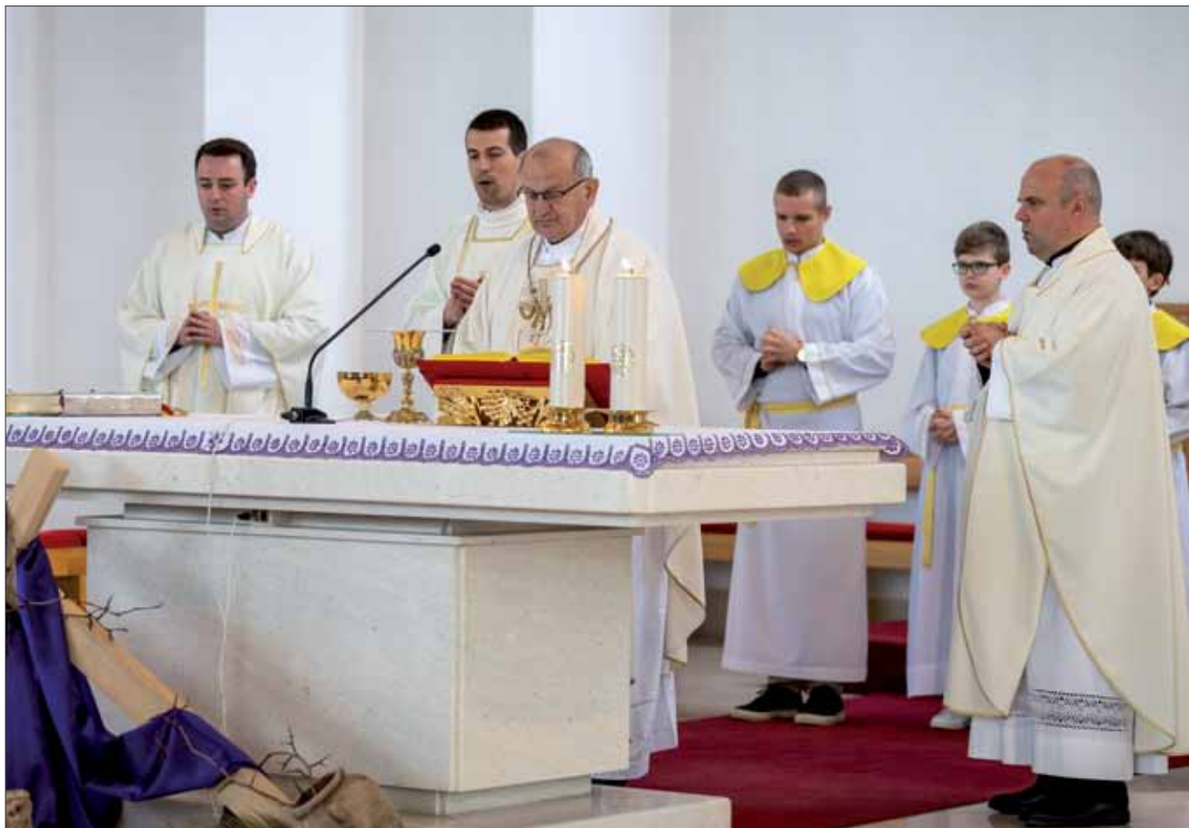
Misno slavlje u crkvi svetog Ivana Krstitelja u Zaprešiću, 19. ožujka 2024.