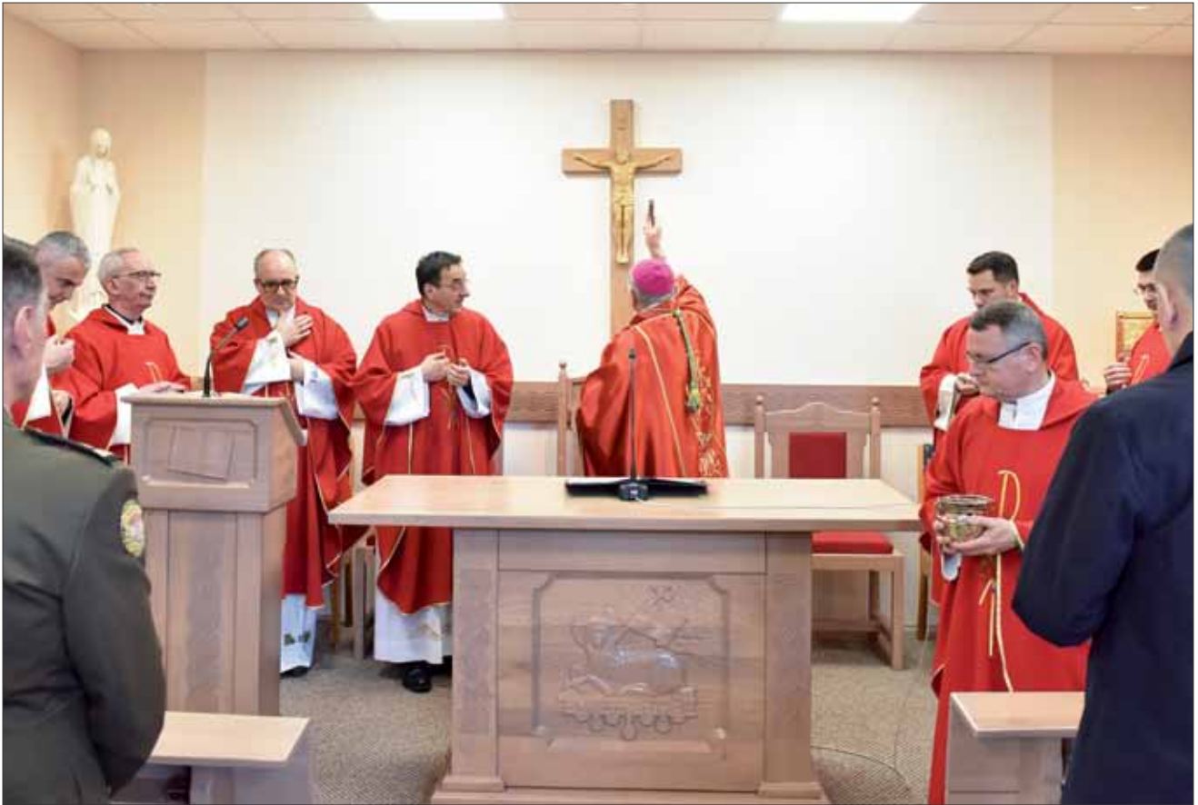
Misa i blagoslov vojne kapelice „Sveti Valentin“ u sjedištu Počasno-zaštitne bojne (PZB) na Tuškancu u Zagrebu, 15. veljače 2024.