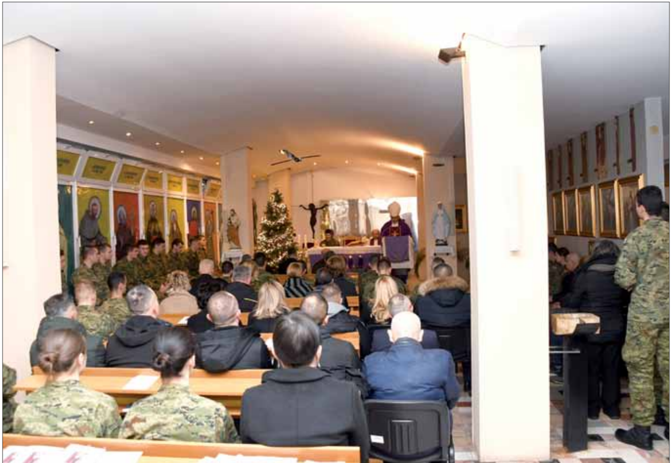
Sveta misa u u kapeli sv. Mihaela arkanđela na HVU, Zagreb, 20. prosinca 2023.