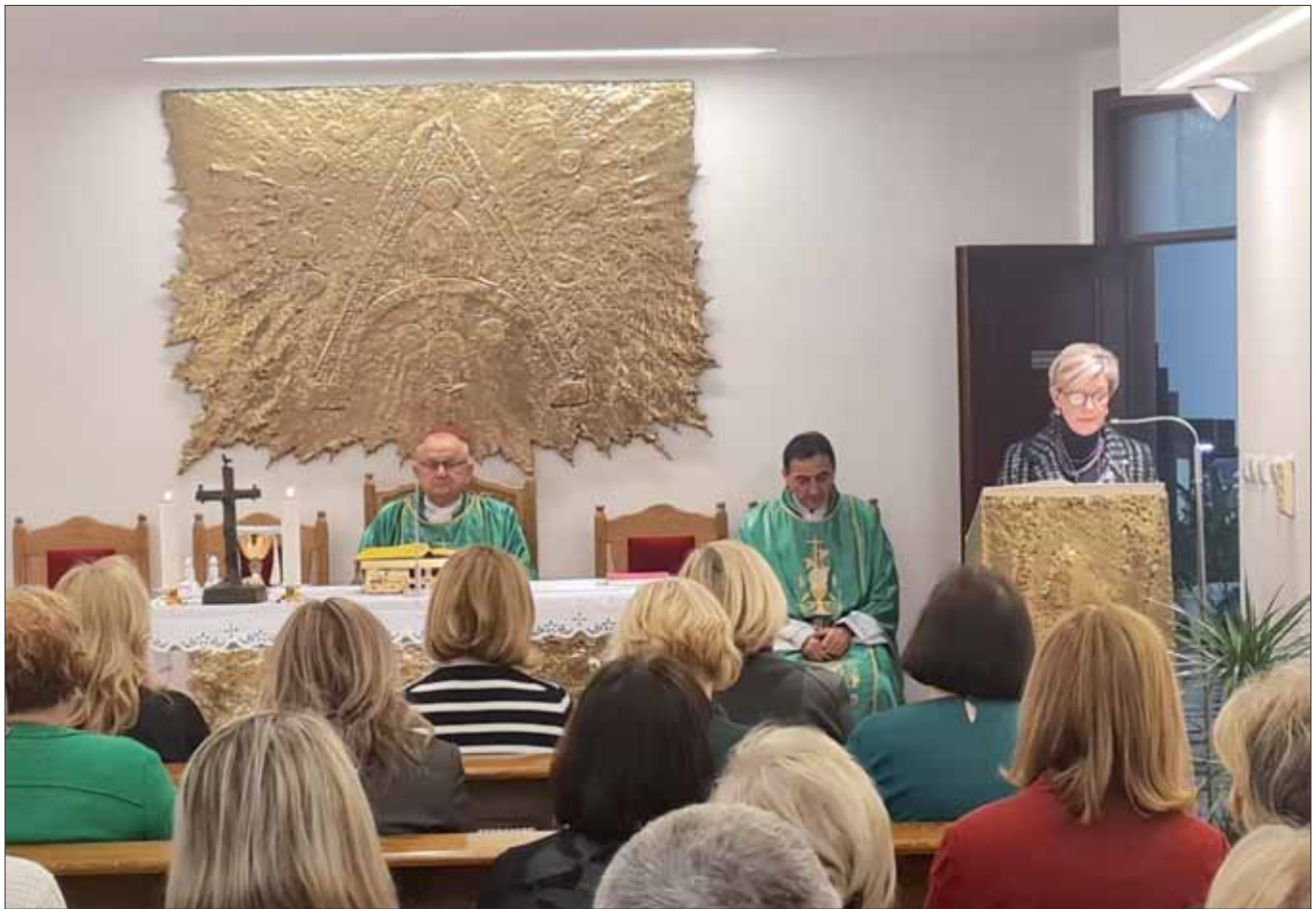
Sveta misa povodom proslave Gospe Lurdske i Dana bolesnika u kapelici Vojnog ordinarijata, Zagreb 11. veljače 2024.

sentimentalnosti. Pokazuje radije tankočutnu skromnost onoga tko pažljivo sluša i djeluje brzo, po mogućnosti tako da ne privuče pažnju drugih. To je divan način očitovanja ljubavi. Treba nad ovim razmišljati i ovaj stil života i djelovanja jednostavno usvojiti“, rekao je biskup Bogdan. Govoreći o važnosti konkretnosti i prisutnosti u ljudskim odnosima i ljubavi, biskup je podsjetio na riječi apostola Jakova: „Ako su koji brat ili sestra goli i bez hrane svagdanje pa im tkogod od vas rekne: ‘Hajdete u miru, grijte se i sitite’, a ne dadnete im što je potrebno za tijelo, koja korist?“ (Jak 2, 15-16)